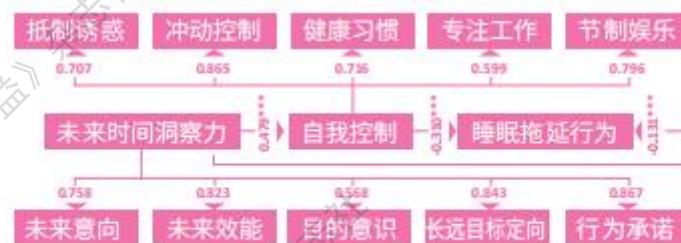
图 1 自我控制在未来时间洞察力与睡眠拖延行为间的 SEM 图

自我控制作为中介因子起到的中介效应 SEM (结构方程模型) 图如图 1 所示。